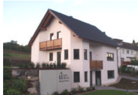
Musterhaus in Sundern

Auch die Experten von Karl Ulrich wissen: Individuelle Wohnsituationen erfordern individuell angepasste Wohnflächen. Wir unterstützen Sie gern schon bei der Planung für die Optimierung Ihrer Immobilie und führen alle von Ihnen gewünschten Maßnahmen aus.